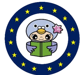
鳩山町デジタル図書館 Hatoyama Town Digital Library